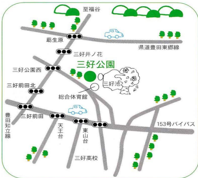
三好公園駐車場位置図